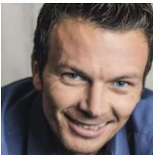
Autor Markus Spenger