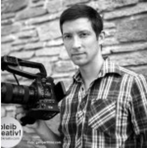
Autor Robert Gamperl gamperlfilms.com